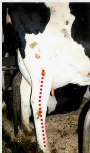
Pernas muito retas PVL= 15