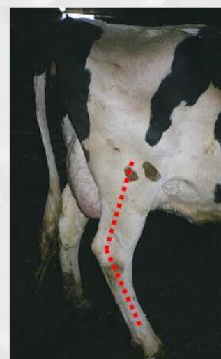
Pernas muito Curvas PVL= 90