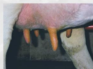
Longo CT= 85