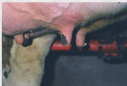
Curto CT= 15